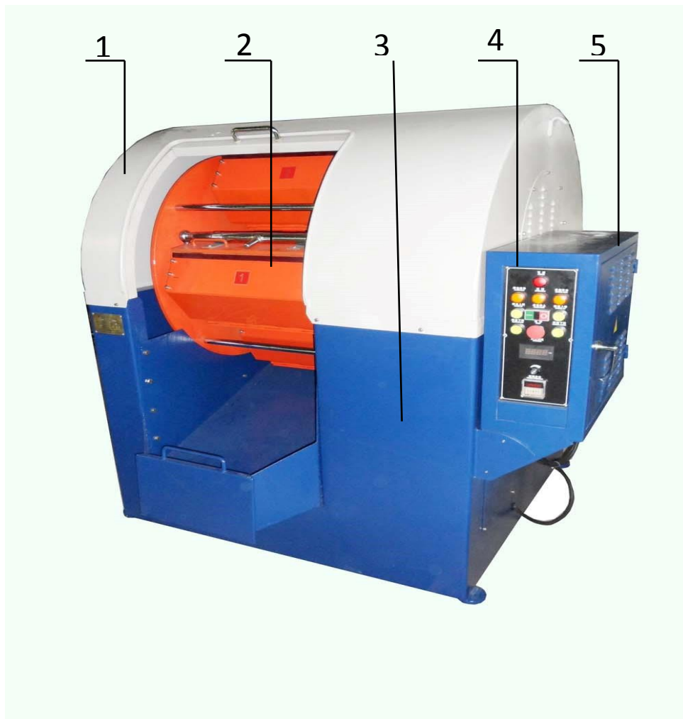
Рис. 1 Внешний вид

1. Корпус выполнен из листовой стали. Каждый конец снабжен прорезью; крышка, которую можно открывать и закрывать, закреплена в передней части корпуса. Для целей безопасности на раме крышки имеется позиционный переключатель. Когда крышку открывают, станок отключается, и диски останавливаются.